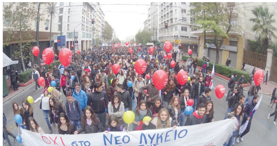
Η συλλογική αγωνιστική δράση της νεολαίας και του λαού συμβάλλει στη διαμόρφωση άλλων αξιών και προτύπων, που βρίσκονται στον αντίποδα της απονικτικής βαρβαρότητας που ζούμε.

Και εδώ είναι φανερό πως στην περίπτωση του σχολικού εκφοβισμού δεν έχουμε να κά-