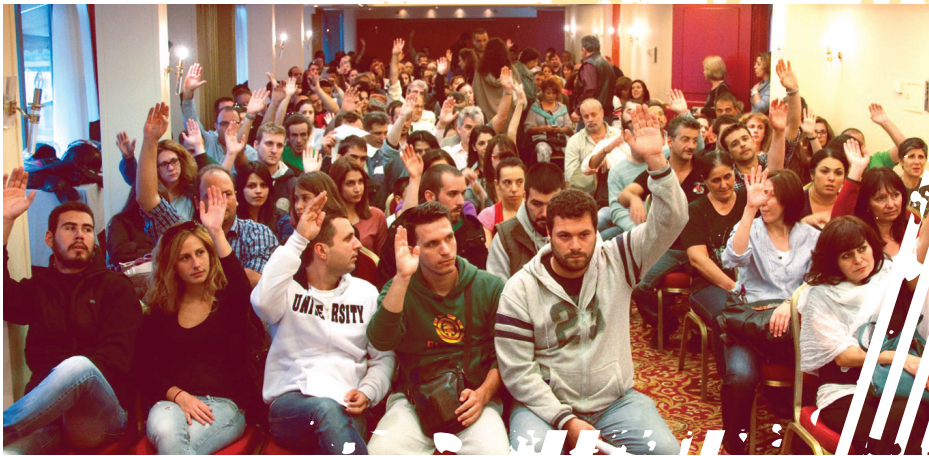
Ψηφοφορία από Γενική Συνέλευση του Συνδικάτου Εργατοϋπαλλήλων Επιστισμού-Τουρισμού-Ξενοδοχείων Αττικής.

Τ α συνδικάτα που συσπειρώνονται στο ΠΑΜΕ έχουν τροποποιήσει το καταστατικό τους ώστε να δέχονται όλους τους εργαζόμενους ανεξάρτητα από τη σχέση εργασίας (μόνιμοι, συμβασιούχοι, extra, εργαζόμενοι σε 5μηνα κ.λπ.). Αντίθετα, πολλά συνδικάτα στα οποία πλειοψηφούν δυνάμεις του κυβερνητικού και εργοδοτικού συνδικαλισμού αρνούνται να κάνουν μέλη τους εργαζόμενους που δεν είναι μόνιμοι, αφήνοντας έτσι ανοργάνωτο το πιο σκληρά εκμεταλλευτό κομμάτι των εργαζομένων, που στην πλειοψηφία τους είναι νέοι, και υπονομεύοντας την αναγκαία ταξική ενότητα των εργαζομένων. Κάθε εργαζόμενος επιτρέπεται να συμμετέχει σε δύο το πολύ σωματεία: ένα εργοστασιακό-επιχειρησιακό και ένα κλαδικό ή ομοιοεπαγγελματικό. Ανήλικοι και αλλοδαποί εργαζόμενοι μπορούν να είναι μέλη συνδικαλιστικών οργανώσεων, το ίδιο και οι απολυμένοι εργαζόμενοι που δεν έχουν πιάσει ακόμα δουλειά σε άλλο κλάδο ή επιχείρηση.