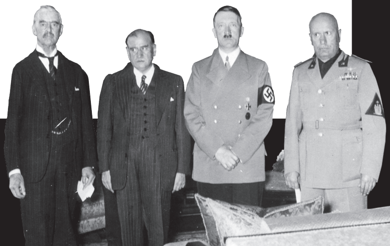
Από αριστερά προς τα δεξιά: Ν. Τσάμπερλεν, πρωθυπουργός της Μεγάλης Βρετανίας, Ε. Νταλαντιέ, πρωθυπουργός της Γαλλίας, Α. Χίτλερ, καγκελάριος της ναζιστικής Γερμανίας και Μπ. Μουσολίνι, πρωθυπουργός της φασιστικής Ιταλίας.

► Λίγα χρόνια μετά το τέλος του πολέμου, με την παρέμβαση των ΗΠΑ, βιομήχανοι και τραπεζίτες που είχαν καταδικαστεί ως εγκληματίες πολέμου γιατί είχαν υποστηρίξει οικονομικά τους ναζί, απαλλάχτηκαν, επέστρεψαν στα διευθυντικά τους πόστα, πήραν πίσω τις περιουσίες τους. Μέχρι και στο NATO εργάστηκαν Γερμανοί στρατηγοί εγκληματίες πολέμου!